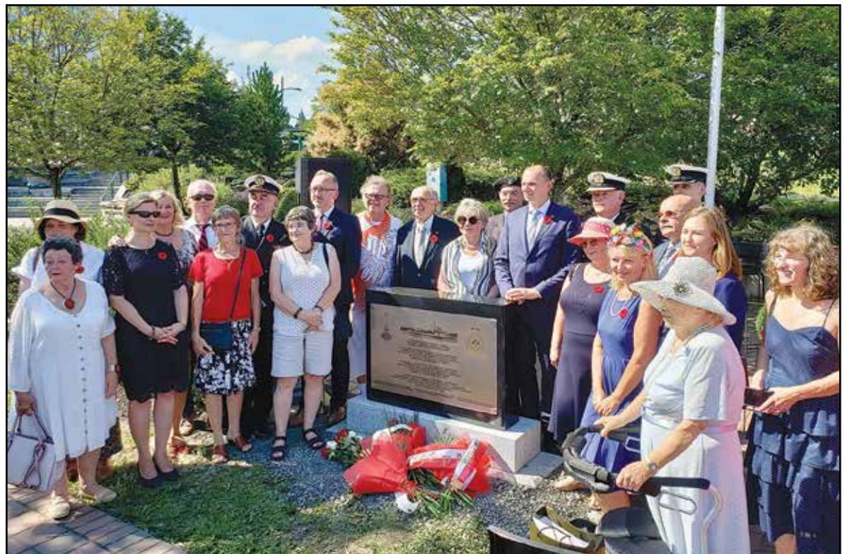
L'importante délégation polonaise a posé derrière la stèle à l'issue de la cérémonie.