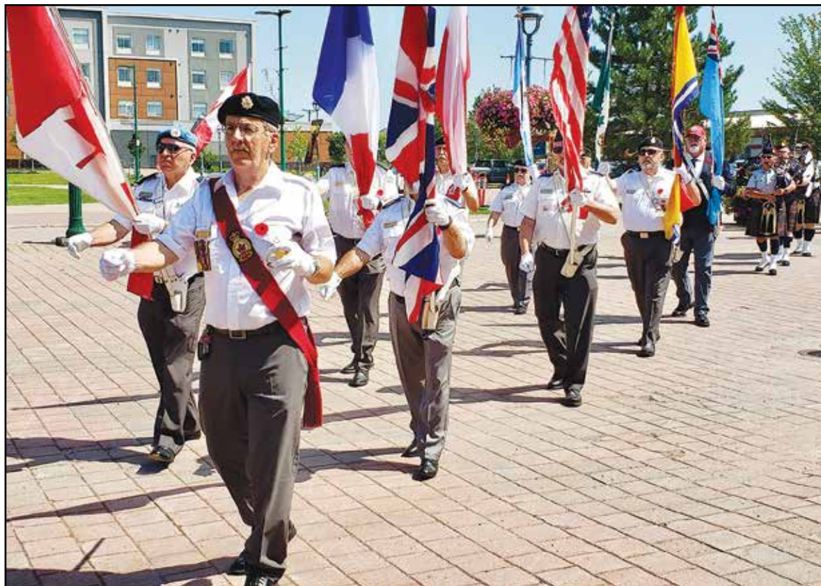
La parade des vétérans militaires de Dieppe.