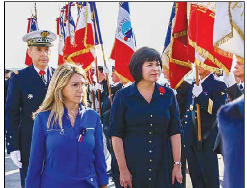
Patricia Mirallès et Ginette Petitpas Taylor.

n'oublions pas ceux qui sont tombés au champ d'honneur, et nous comprenons que c'est grâce à eux que nous avons obtenu de longues années de paix, de stabilité et de démocratie.