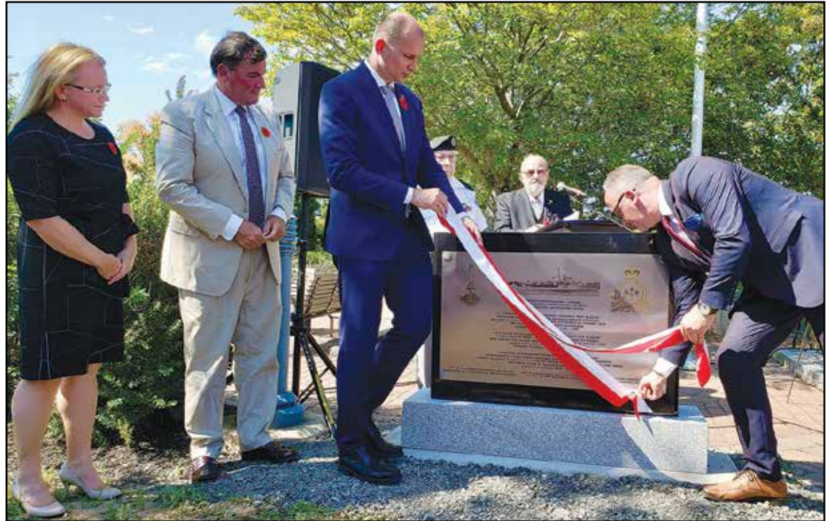
La nouvelle stèle fut dévoilée par l'ambassadeur de Pologne, Witold Dzielski, et le vice-président de l'Institute of National Remembrance de Pologne, Karol Polejowski.

un ordre du commandement britannique. Il a ainsi sauvé 85 soldats canadiens et les a aidés à évacuer la plage. À l'époque, son acte allait à l'encontre des